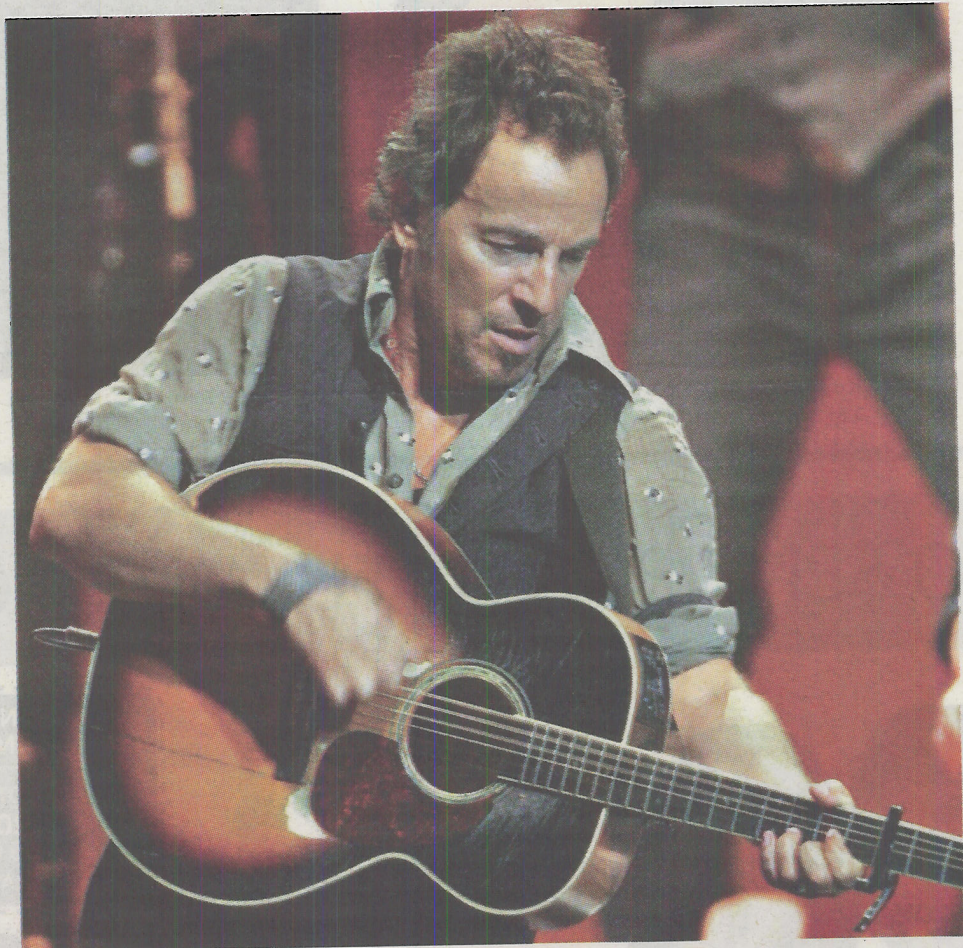
El Boss defendió las canciones de Seeger el 12 de octubre en Hamburgo.

El Boss actuará en cinco escenarios españoles para presentar este álbum, que hunde sus raíces en la obra del cantautor folk Pete Seeger, uno de los más reivindicativos junto a Woody Guthrie y amigo de